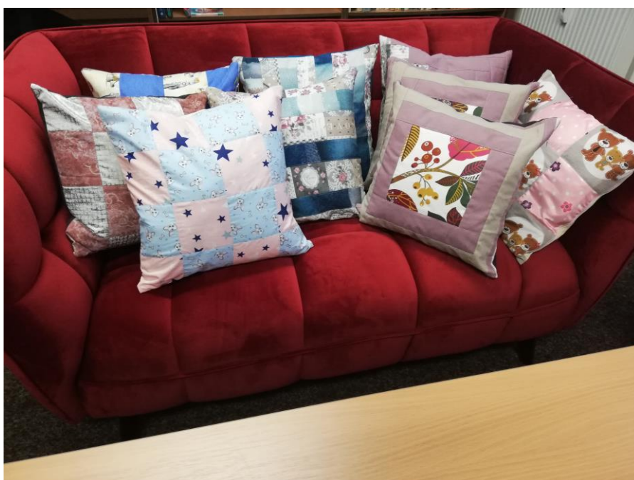
Ukázka vyrobených polštářků

Několik šikovných žen z naší se obce se domluvilo a vytvořilo vlastními silami 20 ks krásných polštářků, které starostka předala na oddělení ARO - Covid v Sokolovské nemocnici, Kynšperským hasičům a pečovatelkám do Horních Pochlovic.