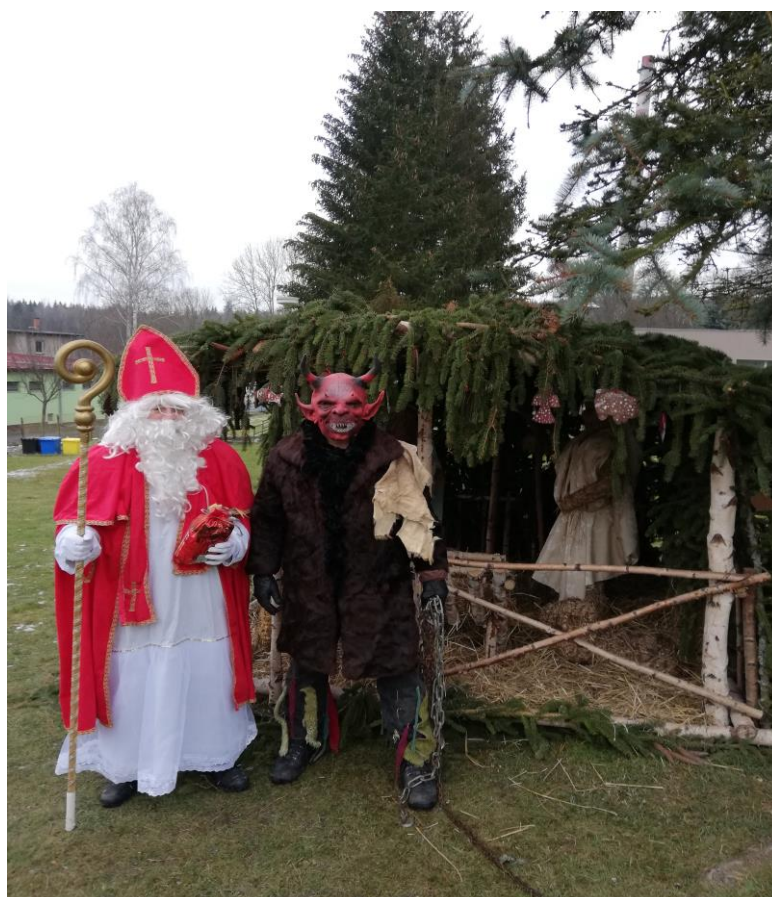
Čert s Mikulášem

Letošní rok byl opravdu zvláštní. V obci kromě oslavy MDŽ a slavnostního zahájení školního roku u příležitosti 60. výročí, neproběhla žádná kulturní ani společenská akce. Byly porušeny veškeré naše tradice – bohužel. Neuskutečnilo se ani adventní zpívání u stromu ani Mikulášská. Abychom naše nejmenší neochudili, tak jsme jim za básničku či písničku, rozdali Mikulášské balíčky u našeho betléma. Tradiční vánoční setkání našich seniorů nahradíme jinou akcí, až to situace dovolí. Pevně věříme, že příští rok se již vše v dobré obrátí.