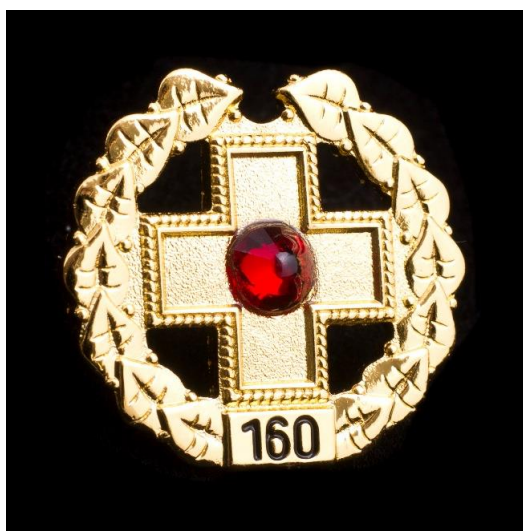
Zlatý kříž ČČK 3. třídy