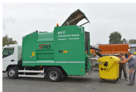
Myčka popelnic

V první polovině května jsme opět nechali umýt nádoby na komunální odpad, abychom přispěli čistějšímu prostředí v obci a lepší hygieně. Mytí již bude probíhat pravidelně.