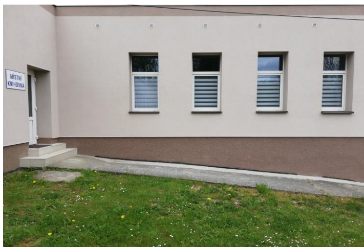
Místní knihovna

Den otevřených dveří v místní knihovně proběhne 14.06.2021 od 10 – 11 hodin a od 15.00 – 17.00 hodin. Tak neváhejte, přijďte se podívat a případně i vypůjčit nějakou knihu. Připomínáme, že knihovnu můžete zdarma využívat pro setkávání menších skupinek lidí (max. 6) zejména z řad seniorů, a to k různým aktivitám – ruční práce, sledování naučných pořadů, skupinové předčítání, hudební produkce, nebo jen tak posedět u kávy. Dveře jsou otevřené pro všechny - stačí se přijít domluvit na Obecní úřad.