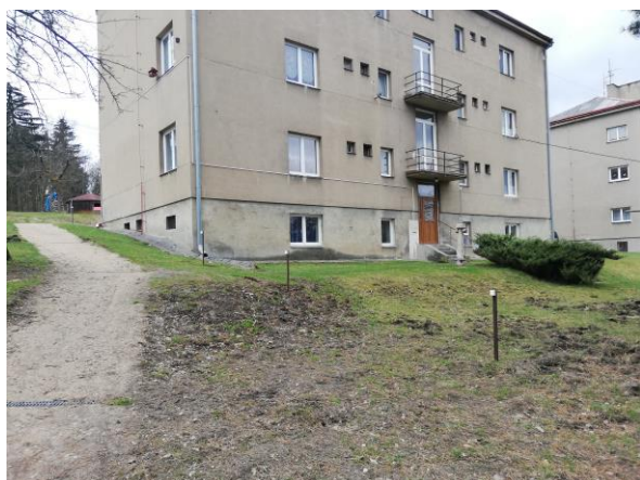
Instalace ohradníků

Jistě jste si všimli zdevastovaného veřejného prostranství téměř po celém katastru obce od divokých prasat. Školní zahrada byla zryta kompletně i přesto, že jsme osadili nový plot. Nakoupili jsme a osadili pachové ohradníky a doufáme, že budou alespoň trochu účinné. Kombinujeme dva druhy odpuzovacích látek tak, aby si na ně zvěř nestihla zvyknout. K této mimořádné invazi prasat zřejmě