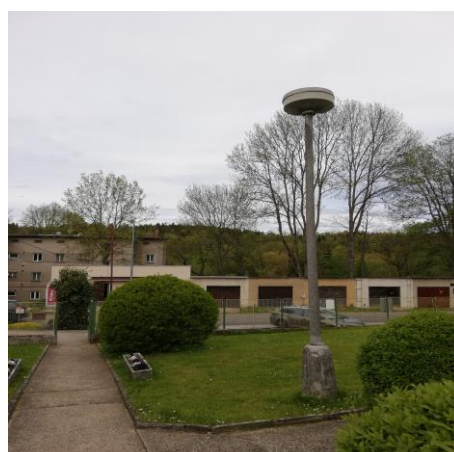
Původní nevyhovující stav

V letošním roce dojde k výměně a doplnění světelných bodů v Libavském Údolí i Kolové. Stávající osvětlení je již velmi zastaralé a nesplňuje současné normy a požadavky. Obnovou dosáhneme nejen lepšího vzhledu, ale i snížení spotřeby elektrické energie. Na tuto akci máme přislíbenou dotaci z Ministerstva životního prostředí ve výši 544 tis. Kč.